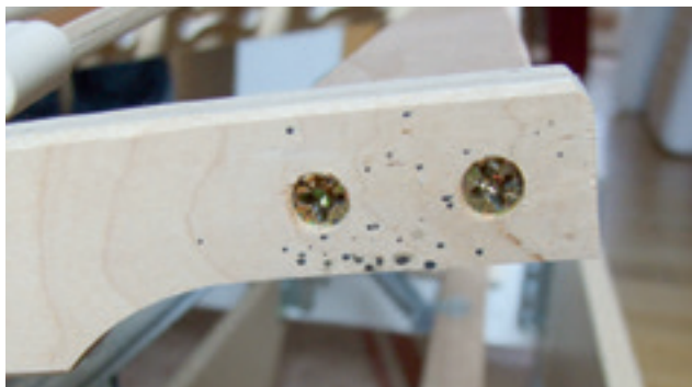
Fig. 1: tracce di escrementi di cimici sulla rete di un letto