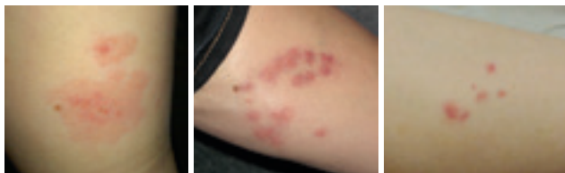
Fig. 3: esempi di punture delle cimici dei letti

Dopo una puntura, la reazione cutanea può variare notevolmente da persona a persona (vedi figura 3). Alcune persone non hanno alcuna reazione, altre presentano pustole arrossate e pruriginose (con un diametro che va da pochi millimetri a qualche centimetro), vesciche e ponfi. La reazione può avvenire anche in un momento successivo (fino a 10 giorni dopo la puntura). Per questo, può essere talvolta difficile stabilire il luogo in cui si è stati punti. Di solito, le punture delle cimici dei letti sono disposte in gruppi o in linea, ma possono anche manifestarsi singolarmente.